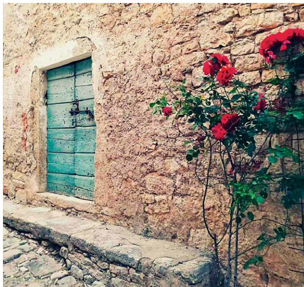
Molitva - ključ koji otvara vrata srca